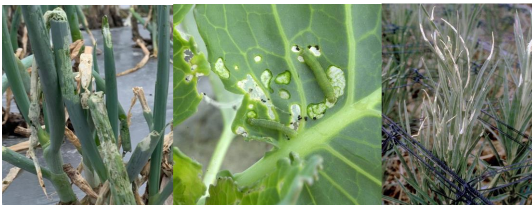
写真3 シロイチモジヨトウによる被害 (左：ネギ、中：キャベツ、右：カーネーション)