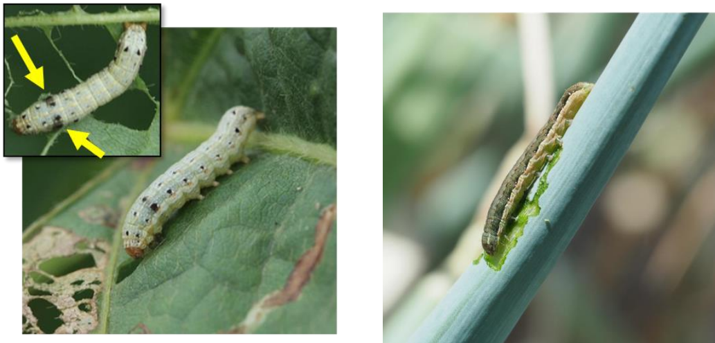
写真2 中・老齢幼虫 (左：ハスモンヨトウ、右：シロイチモジヨトウ)

(左：シロイチモジヨトウの卵塊、右：「白変葉」と呼ばれるダイズの初期食害葉と葉裏に群棲する若齢幼虫)