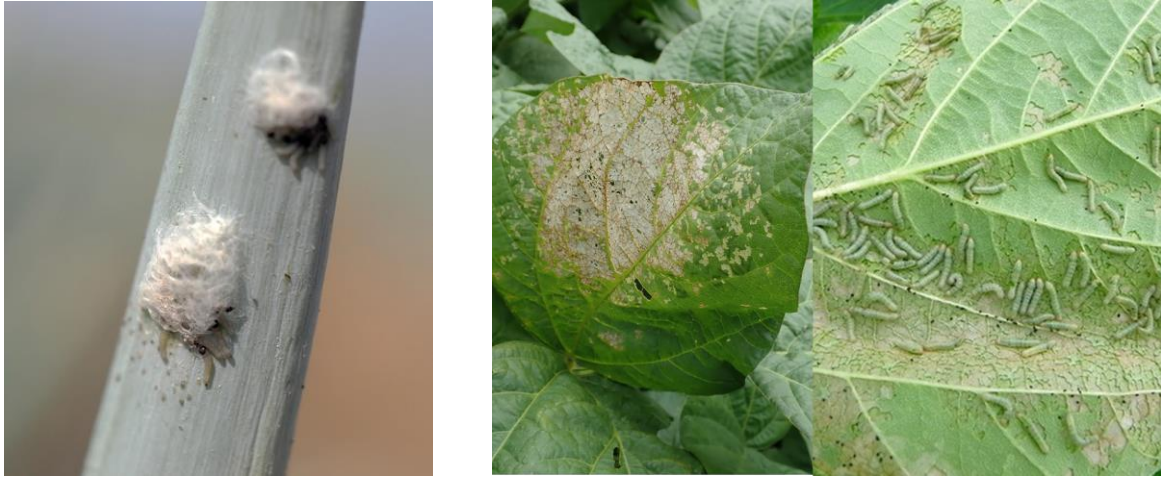
写真1 卵塊及び群棲する若齢幼虫

(左：シロイチモジヨトウの卵塊、右：「白変葉」と呼ばれるダイズの初期食害葉と葉裏に群棲する若齢幼虫)