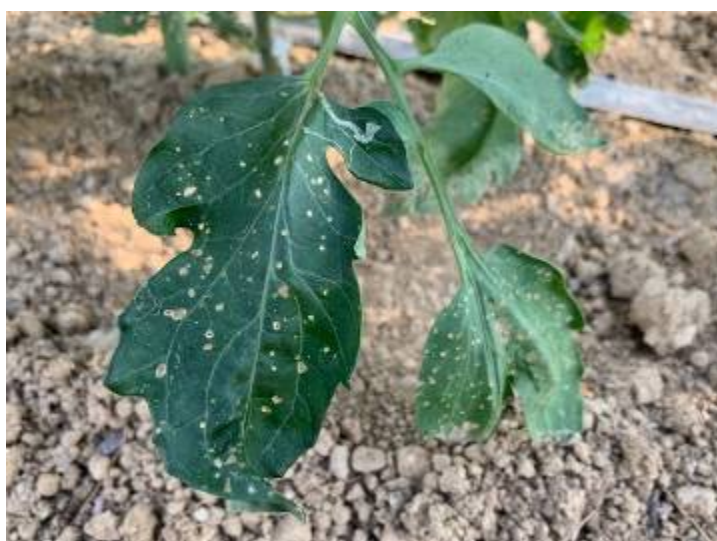
写真4 トマトの被害葉