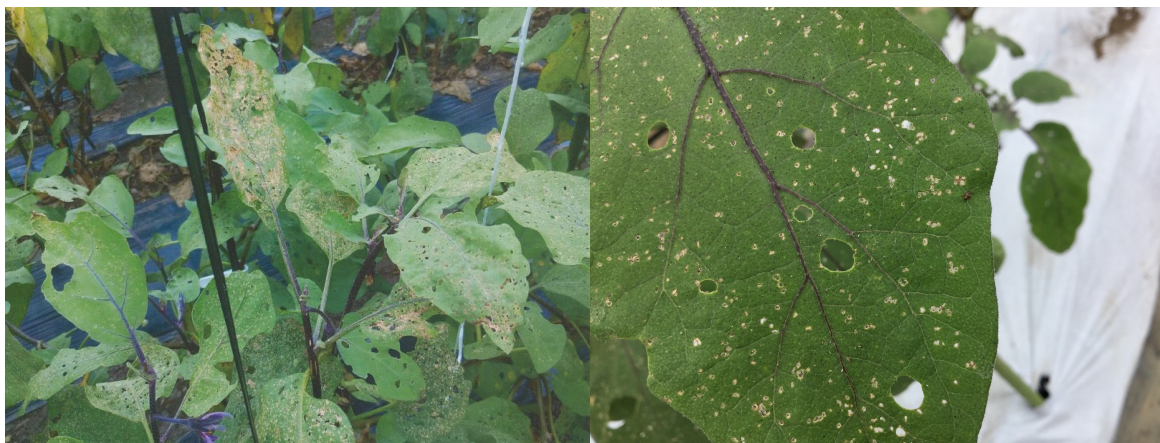
写真3 ナスの被害葉