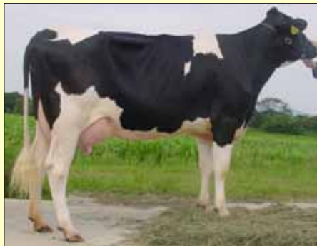
北海道から導入されたスーパーカウ