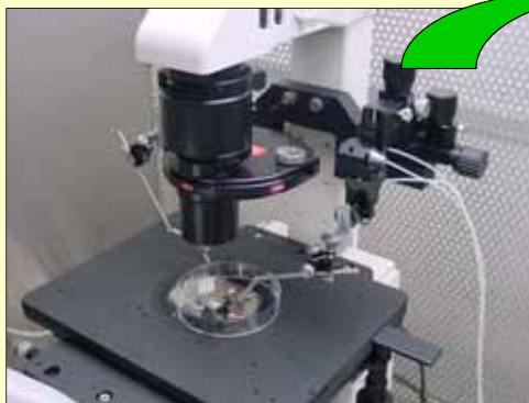
マイクロマニピュレーターを用いた受精卵の切断サンプリング