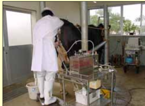
過剰排卵処理後の受精卵の回収