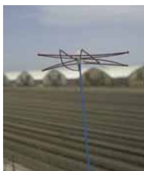
ポリエチレンチューブに入った性フェロモン