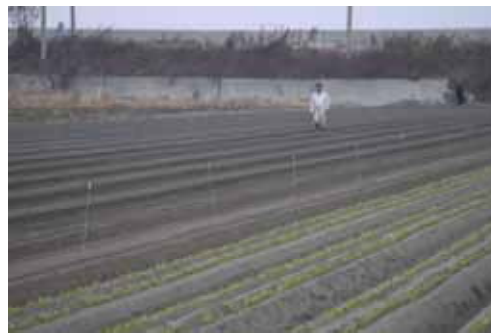
性フェロモンをほ場内に均一に設置