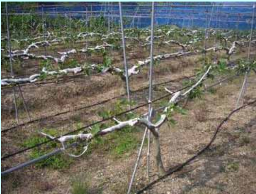
慣行の栽植密度:うね幅2m、株間4m