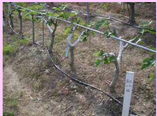
5倍密植:うね幅2m、株間0.8m