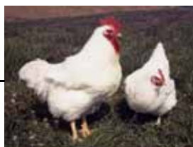
白色プリマスロック 雌雄 (羽毛色劣性)