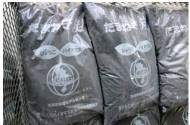
生産されたタマネギ炭化物 (土壌改良資材)