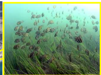
アマモ場とイシダイの群れ