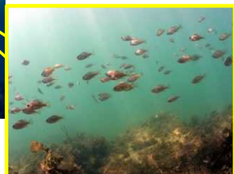
防波堤内側にシロメバルの群れ

魚の棲みやすさを0（棲みにくい）～1（棲みやすい）の数値で評価し、20mメッシュで色分けしました。