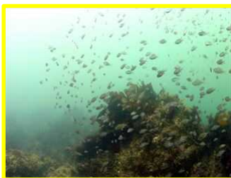
防波堤外側の捨て石にシロメバル・スズメダイの群れ