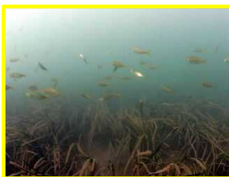
アマモ場にマアジの群れ

【背景・目的・成果】 漁港は漁船の係船や水産物の水揚げといった産業活動の場であると同時に、「魚の棲みか」にもなっているといわれてきました。しかし漁港が持つ魚の保護・育成効果は、今まで客観的に評価できていませんでした。そこで漁港区域を総合的に調査し、魚の「棲みやすさ」を評価しました。この指標を用いると、「棲みやすさ」を高めるためのいろいろな手法について、その効果を予測することができます。