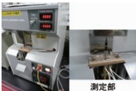
写真 動的粘弾性測定装置 (RHEOLOGRAPH SOL)