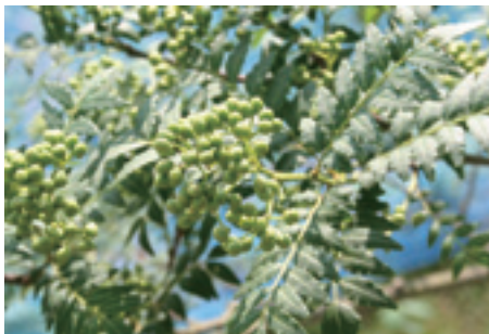
写真1 アサクラサンショウ果実