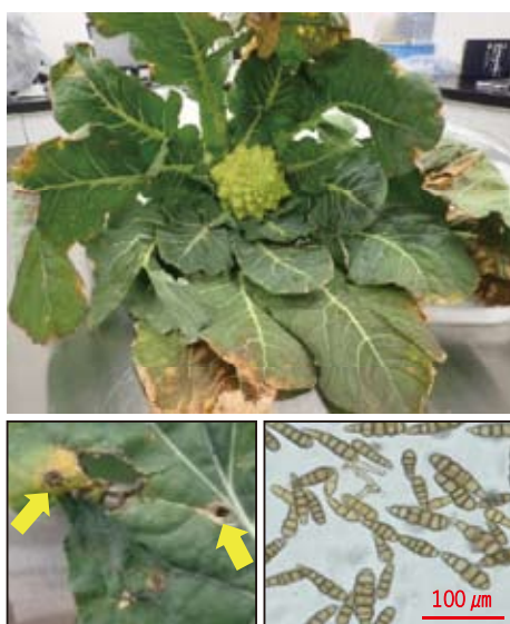
写真1 カリフラワーの黄化症状(上) 写真2 カリフラワー病斑(矢印) (左下) 写真3 検鏡した Alternaria brassicicola (右下)

2019年11月上旬に圃場全域で主に下葉から黄化する症状がみられた（写真1、2）。発生圃場は、過去のアブラナ科の作付け履歴及び発病経歴はない。被害葉は、輪紋状の病斑がみられ、古い病斑の中心部分は破れていた。実体顕微鏡の観察で病斑部分に菌叢がみられた。セロテープで剥ぎ取り、検鏡したところ、 Alternaria 属菌の分生子（孢子）が認められた。孢子の大きさ、形状、連鎖数等の特徴が Alternaria brassicicola と一致したため、カリフラワー黒すす病と診断した（写真3）。