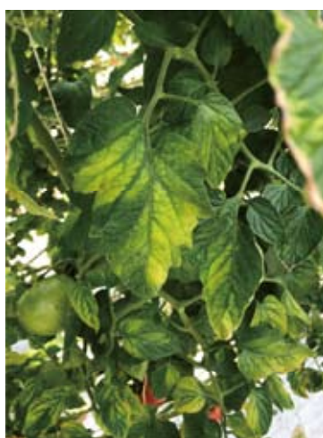
写真4 トマト黄化病の初期病徴