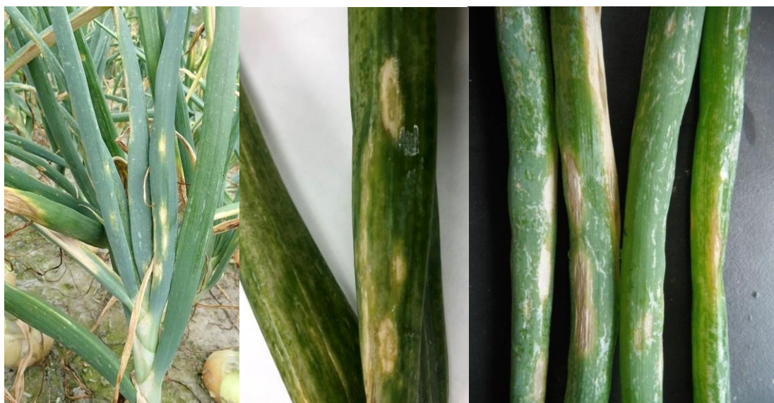
写真2 タマネギ 左：圃場における条斑、中：条斑症状の拡大図、 右：癒合した条斑とネギアザミウマのカスリ状食害痕