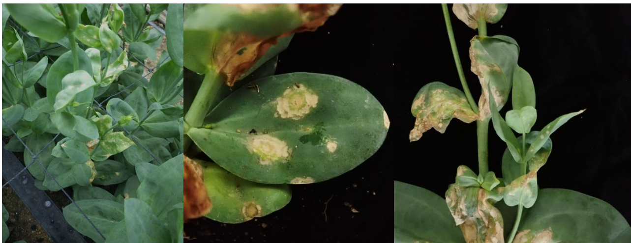
写真3 トルコギキョウ 左：圃場における発病状況、葉にえそ斑が生じている。 中：えそ輪紋症状、 右：えそ症状が激しく、葉が変形している。