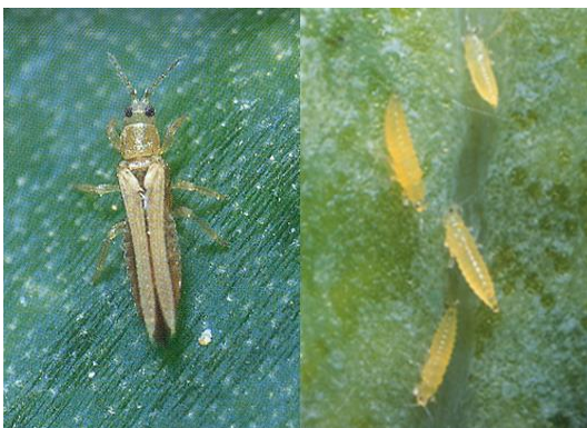
写真5 ネギアザミウマ 成虫(左)と幼虫(右)