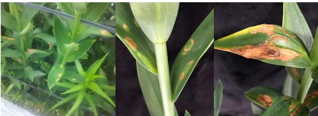
写真4 テッポウユリ 左：圃場における発病状況。中上位葉にえそ輪紋が生じている。中：初期病斑、退緑した病斑(矢印) 右：癒合した不定形病斑