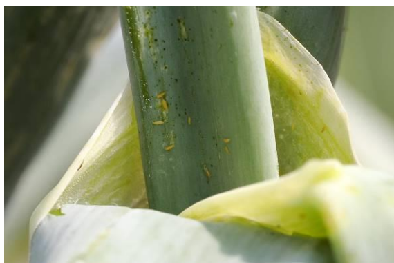
写真6 タマネギ新葉の隙間に寄生するネギアザミウマ幼虫