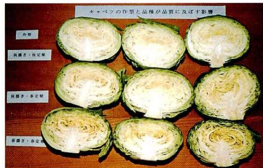
高原初夏どりキャベツの作型と品種