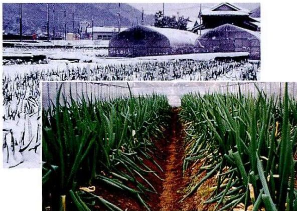
岩津ネギの雪除けハウス栽培