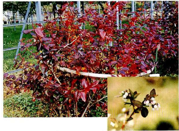
ブルーベリーの紅葉と花