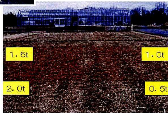
黒大豆ガラ施用試験