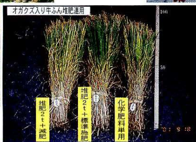
オガクズ入り牛ふん堆肥の連用試験