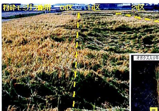
粉碎モミガラ施用試験