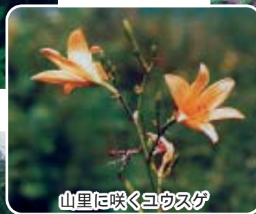
山里に咲くユウスゲ