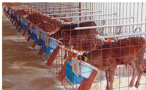
ほ育期の飼養試験