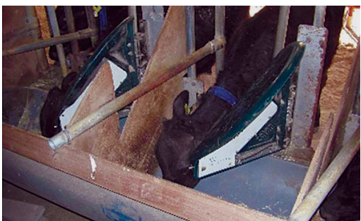
育成期の飼養試験