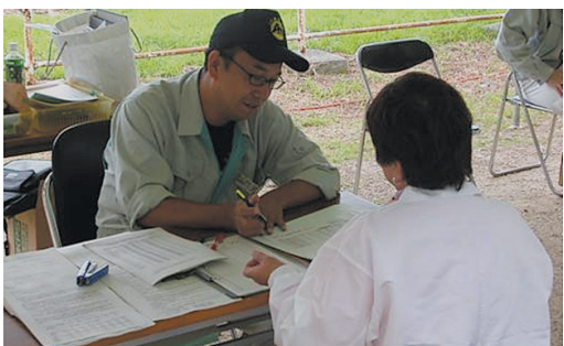
農業改良普及センター職員による交配指導