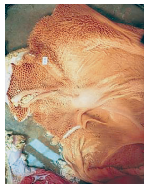
胃粘膜（第一・二胃）の発達の違い（10か月齢） 粗飼料多給（上）と濃厚飼料多給（下）