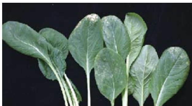
写真 コマツナの葉先枯れ症状

2006年頃から県南部地域においてコマツナの葉が枯れる障害の報告があり、その原因究明と対策技術の確立に取り組んだ。葉枯症状(写真)の発生が顕著であった圃場の土壌は、兵庫県の目標値に比べて交換性石灰が 528\text{mg}/100\text{g} と高く、交換性カリが 18\text{mg}/100\text{g} とやや低かった。また、障害の発生程度が大きいほど植物体のカリウム含量は低かった。カリウムが欠如した水耕栽培で障害の発生を確認したところ、現地の葉枯症状と類似の症状が再現され、本障害をコマツナのカリウム欠乏症と診断した。コマツナのカリウム欠乏症状は、主に生育後半の中位葉に発生が見られた。発生初期はかすり状に黄化し、障害が進行すると斑点状に壊死するが、株が枯れることはない。一般的に交換性石灰が蓄積した土壌ではカリウムの植物への吸収が阻害されることが知られている。そこで、コマツナのカリウム欠乏症の発生を抑制する交換性カリ/交換性石灰のバランスについて検討した。