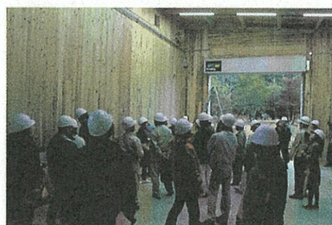
木材乾燥舎の見学の様子

当センターは、原木の大径化に対応する横架材利用の拡大に向け、平成29年度補正予算「生産性革命に資する地方創生拠点整備交付金」（内閣府）を活用し、木材利用実験棟を増築するなど研究機能の強化を図りました。当施設は「高強度梁仕口 Tajima TAPOS」「心去り二丁取り平角」「WoodFFT」の研究成果や、CLT等の最新の技術を活用し、オール県産木材で建築されました。参加者は、CLTパネル工法やスギ・コウヨウザンの羽目板の肌触りや材質を熱心に確認するなど、最新の木造建築に興味を示していました。