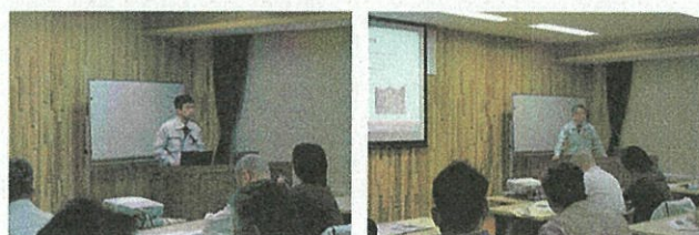
当センター職員からの話題提供

設計段階から工事監督まで携わった経験から、公共木造建築を実現するための提案について発表がありました。