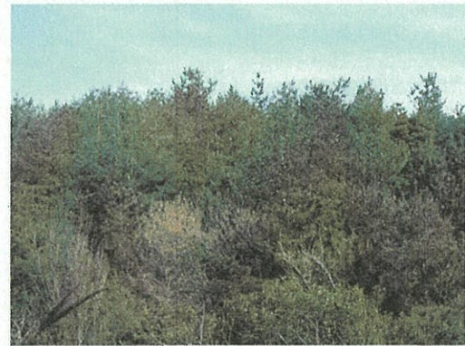
南あわじ市沼島（ひょうご元気松調査地）