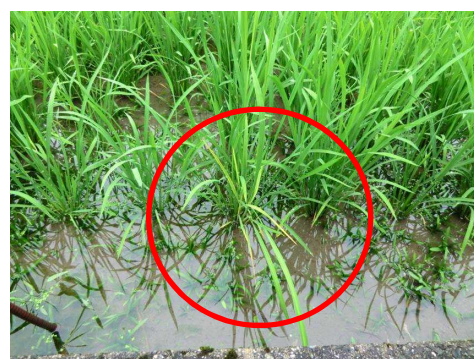
写真 ばか苗病発病状況