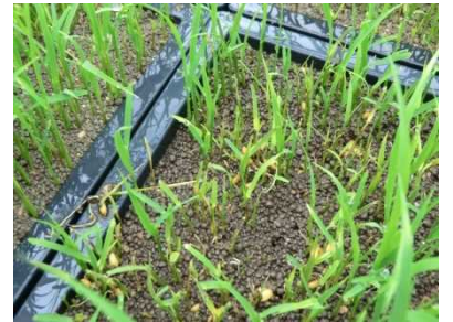
写真 苗腐敗症 (もみ枯細菌病菌)