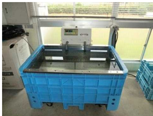
写真 温湯種子消毒装置