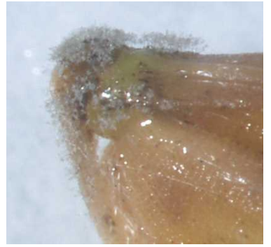
写真 いもち病罹病稲