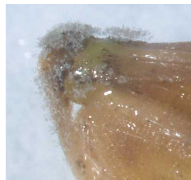
写真 いもち病罹病籾