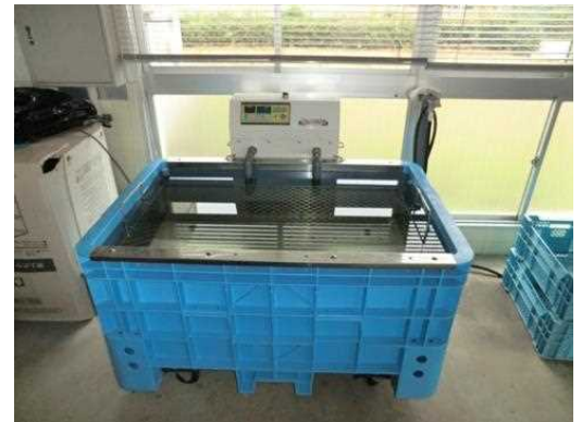
写真 温湯種子消毒装置