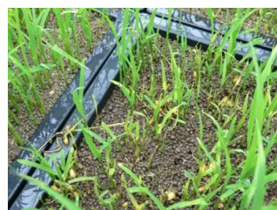
写真 苗腐敗症 (もみ枯細菌病菌)