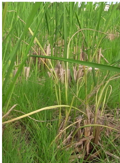
写真2 再生稲（ひこばえ）の発病株

ヒメトビウンカの越冬場所になるため、冬から春にかけて雑草が繁茂する環境を作らない。