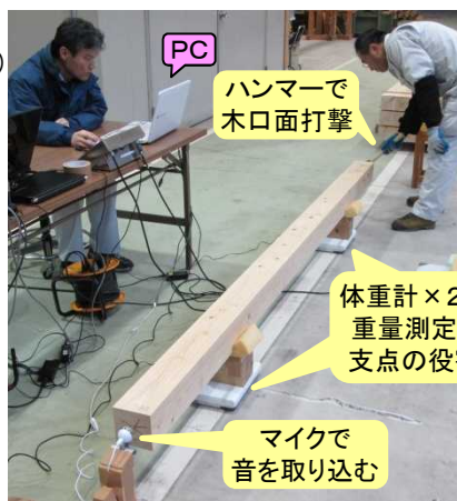
縦振動法による たわみにくさ(Efr)の測定