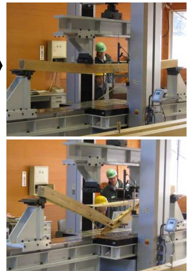
実際のたわみにくさ(Em)を測定