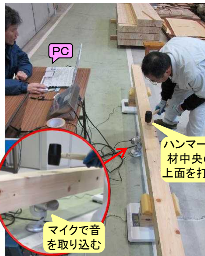
曲げたわみ振動法による たわみにくさ(Eafb)の測定