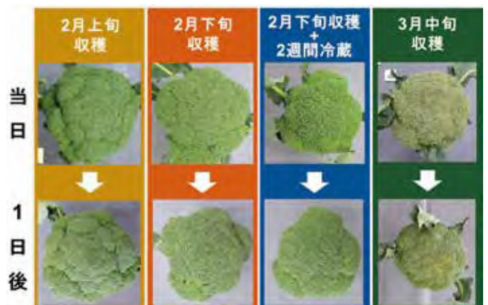
図2 収穫時期、冷蔵によるブロッコリーの外観の違い