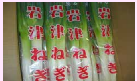
平床栽培によりネギの初期生育は旺盛