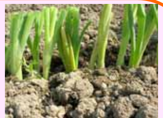
慣行地床苗を平床に機械定植可能