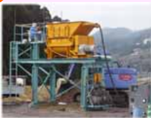
植生基盤材製造プラント