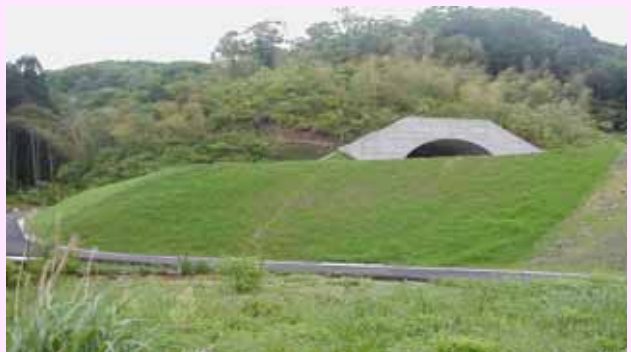
撒き出し3か月後(5月)

兵庫県立農林水産技術総合センター 北部農業技術センター 農業部 グラウンドカバープランツ緑化研究会