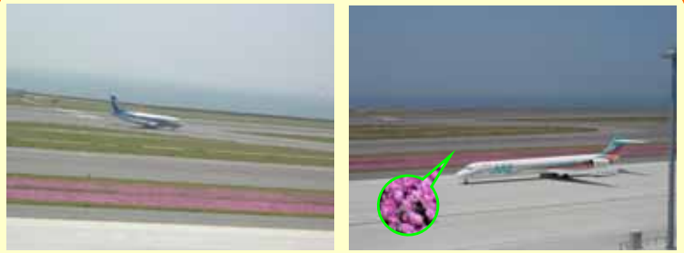
中部国際空港(愛知県常滑市)