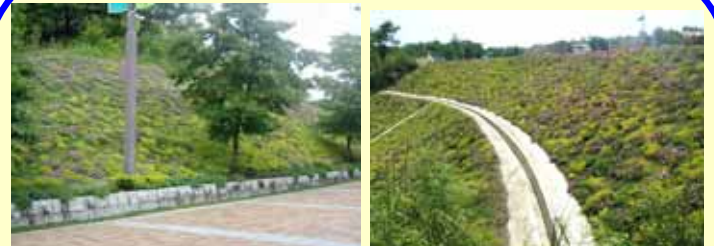
花フェスタ記念公園(岐阜県) 備北丘陵公園(広島県)