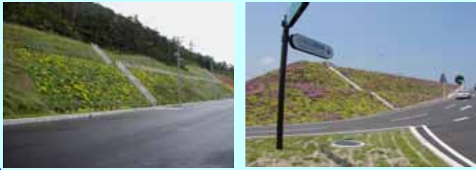
国道429号(岡山県) とらまる公園進入路(香川県)