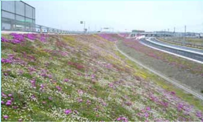
知多横断道路(愛知県常滑市)