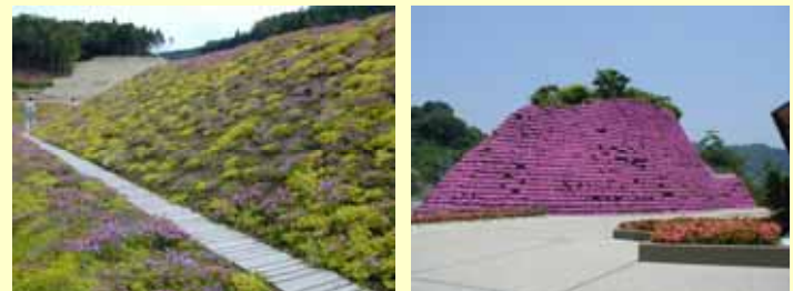
丹波並木道中央公園(篠山市)