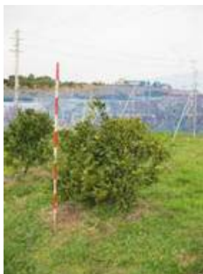
通常台木の「不知火」