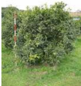
強勢台木の「不知火」

「不知火(デコポン)」...収穫量が強 勢台木「シングルシトルメロ」利用で 通常の2倍に向上した。