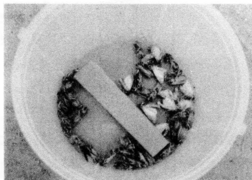
図2 「飛んで器に入るオオタバコガ」