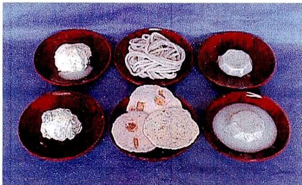
「むきまめ」を利用した加工品

上段: 左からアイスクリーム(ソース)、うどん、ゼリー 下段: 左からアイスクリーム(トッピング)、せんべい、ゼリー(ソース)