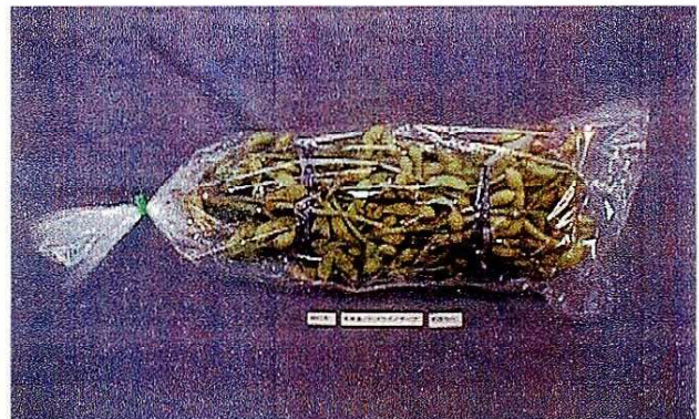
枝付き枝豆の鮮度保持包装