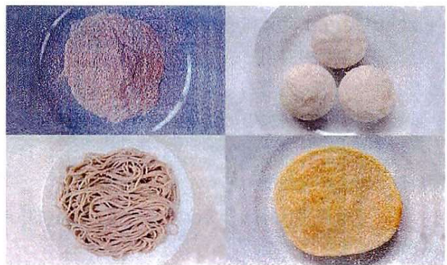
ヤマノイモ加工品

上段: 左からアイスクリーム(ソース)、うどん、ゼリー 下段: 左からアイスクリーム(トッピング)、せんべい、ゼリー(ソース)