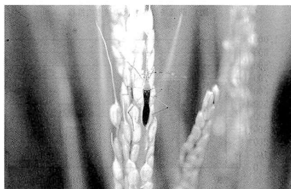
水稻の穂を吸汁するクモヘリカメムシ成虫