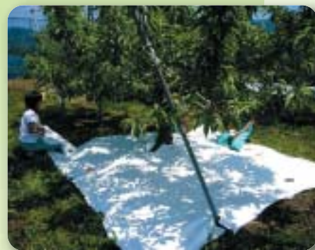
マルチ敷設により水分変動の緩和