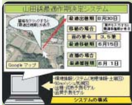
山田錦の作期決定システムの開発