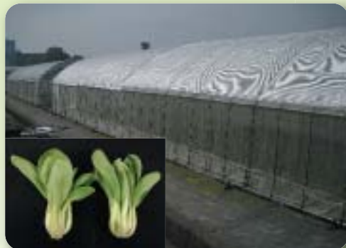
被覆資材で遮熱栽培したチンゲンサイ