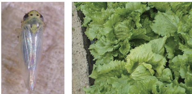
写真 ヒメフタテンヨコバイ♀成虫（左 体長：約3mm）と萎黄病（右 黄化及び萎縮）

本種は成幼虫で越冬後、付近の雑草や水稻に移動し増殖した後、秋期にはレタスに移動する。