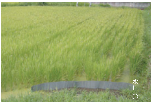
写真 常時入水田の様子（B圃）